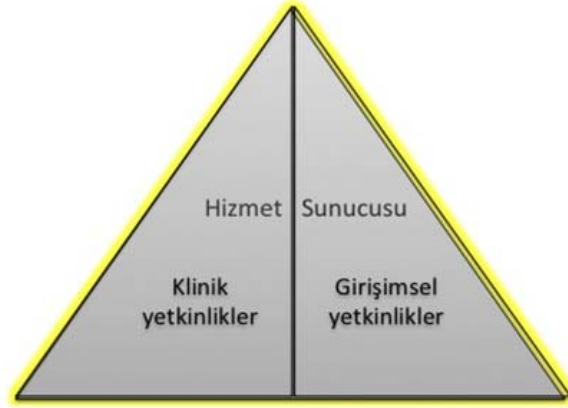
Şekil 2- TUKMOS yedinci temel yetkinlik alanı: Hizmet Sunucusu

Girişimsel Yetkinlik: Bilgiyi, kişisel, sosyal ve/veya metodolojik becerileri tıbbi girişimler konusunda kullanabilme yeteneğidir.